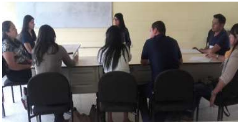
Figura 1. Grupo Focal de Estudiantes en Ciudad Universitaria

Es un tipo de entrevista, en la que los actores se expresan con libertad en temas propuestos por el entrevistador mediante una guía de preguntas. Esta se desarrolló con los docentes y autoridades seleccionados para el estudio a través de 15 preguntas.