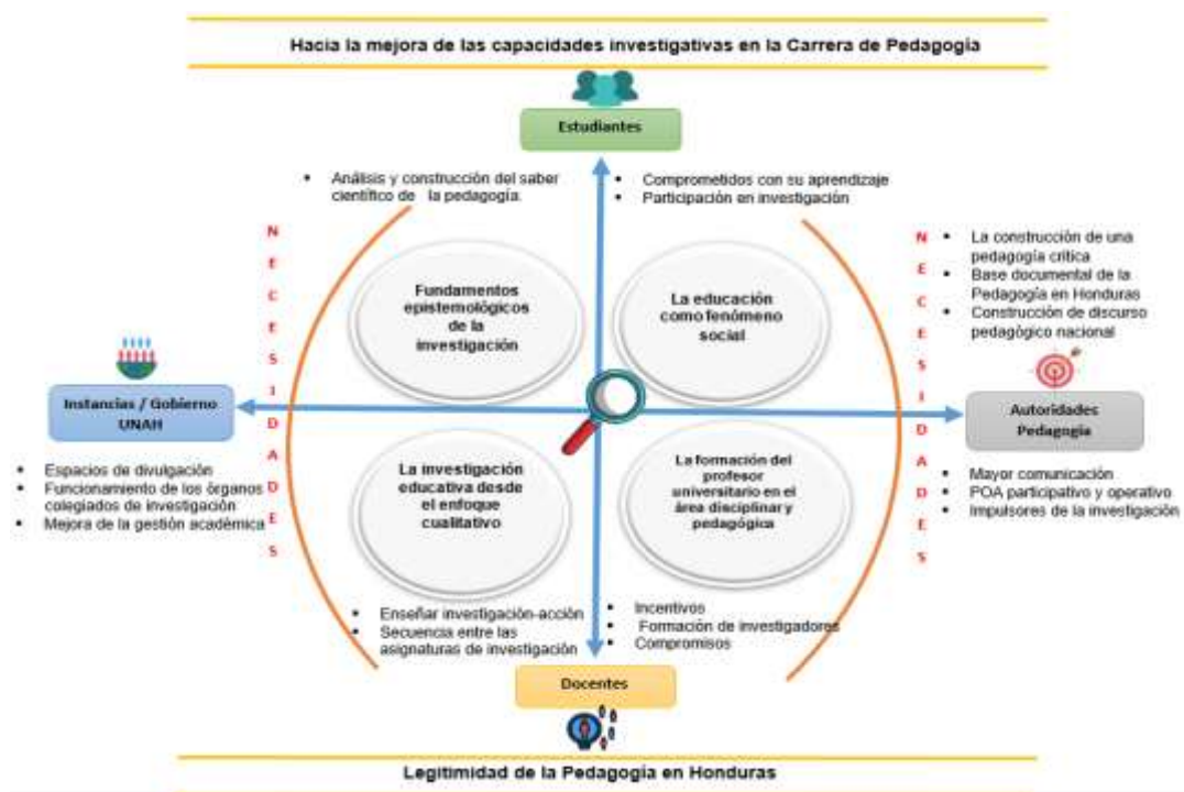
Figura 2. Ejes problematizadores y sus resultados

disciplinar y pedagógica. Se establecieron algunas reflexiones como la necesidad de construir el saber científico de la pedagogía determinando para ello, la necesidad de desarrollar el discurso pedagógico nacional. Por otra parte, se deben de consolidar procesos de formación pertinentes y construir una cultura investigativa en la Carrera. En cuanto a formación del profesorado universitario en el área disciplinar y pedagógica, los docentes manifestaron la necesidad de incentivos como pasantía, intercambios a nivel nacional e internacional, la necesidad de ampliar la oferta en formación de investigadores, promover convenios con organismos internacionales, desarrollo de eventos académicos de calidad, entre otros.