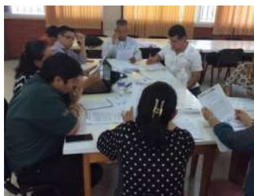
Mesa de trabajo Fundamentos Epistemológicos de la investigación

Como extensión y puesta en práctica del desarrollo del estudio, la Unidad de Gestión de la Investigación Científica de Pedagogía, propuso, planificó y llevó a cabo los días 29 y 30 de agosto de 2019, el Primer Encuentro de Profesores de Pedagogía por la Investigación Educativa, mediante el cual se estableció la ruta “hacia la mejora de las capacidades investigativas en la licenciatura de Pedagogía”, considerando al profesorado de la Carrera en las modalidades presencial y a distancia, los cuales fueron partícipes del proceso de reflexión convocado.